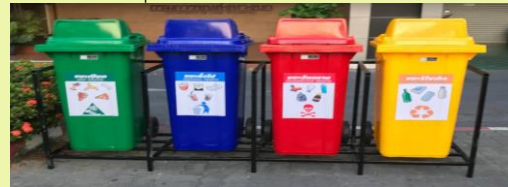
ภาพประกอบตัวอย่าง

ลดจุดทิ้งขยะเหลือจำนวน 6 จุด จุดละ 3 ถัง ในการลดจุดทิ้งขยะจะมีการดำเนินการจัดเก็บข้อมูลขยะปริมาณการล้นของขยะ เพื่อหาแนวทางปรับปรุงต่อไป