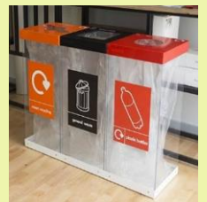
ภาพประกอบตัวอย่าง