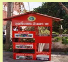
ภาพประกอบตัวอย่าง

กำหนดจุดทิ้งขยะอันตราย บริเวณด้านข้างสำนักงานโครงการจัดตั้งกองอาคารสถานที่และบริการ เช่น ขยะประเภทหลอดไฟฟ้า ถ่านไฟฉาย เป็นต้น